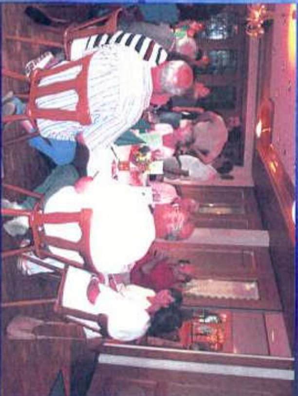
Abendessen Teilnehmer am Freitagabend Hotel Linde