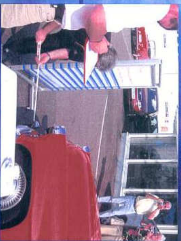
Abstandsmessung im Autohaus Pabst