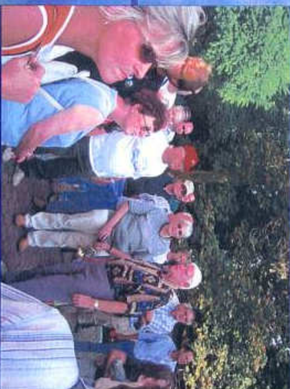
Während der Stadtführung in Braunfels