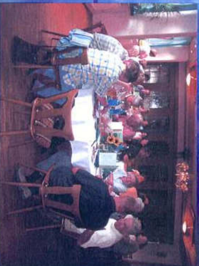
Abendessen Teilnehmer am Freitagabend Hotel Linde