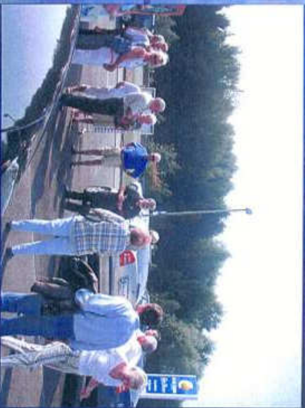
Abstandsmessung am Autohaus Pabst wird erläutert