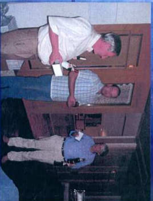
Für die Organisation gibt es eine Flasche Wein