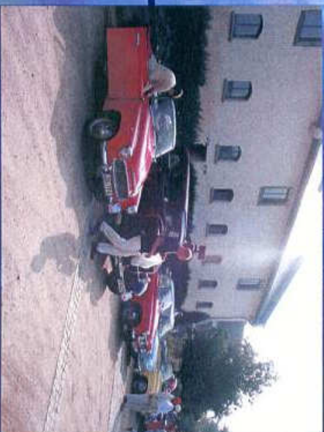
Rast in der Ökumenischen Kommunität Gnadenthal