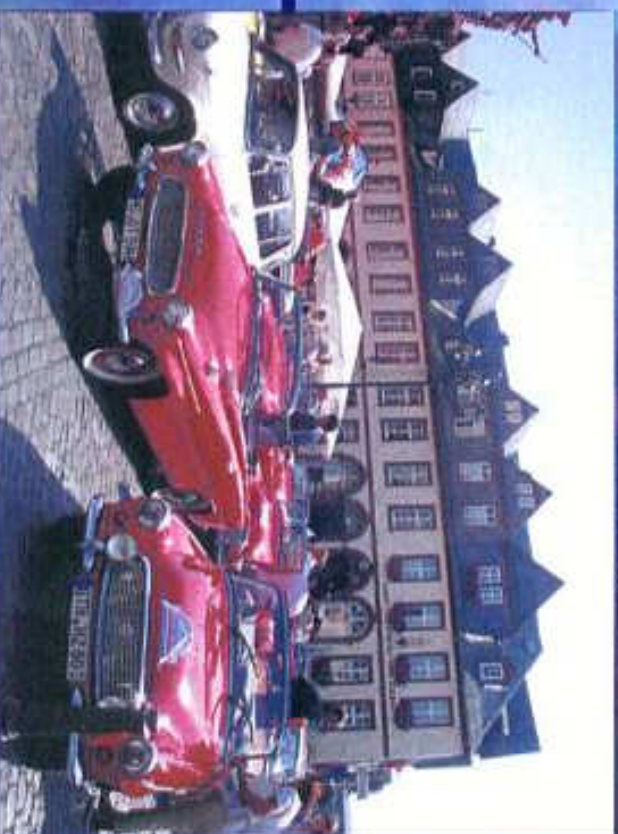
Fahrzeuge auf dem Marktplatz in Weilburg an der Lahn