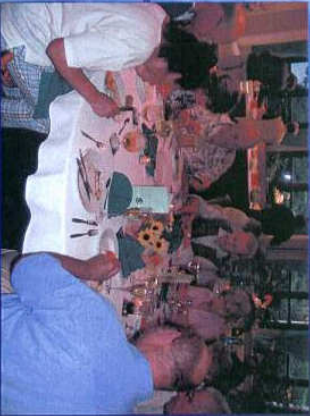
Tischgemeinschaft im Hotel zur Linde in Gemünden