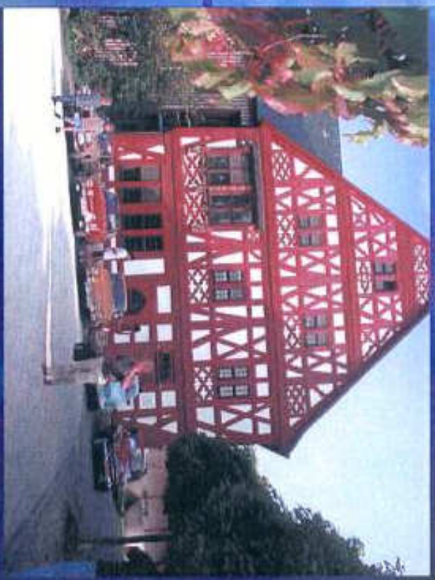
Rast in der Ökumenischen Kommunität Gnadenthal