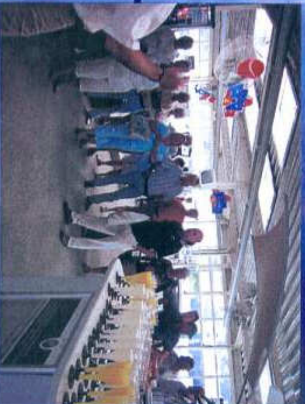
Buffet im Autohaus Pabst in Diez an der Lahn