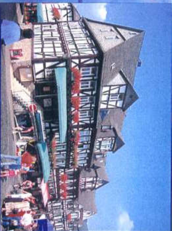
Stadtführung in Braunfels Marktplatz