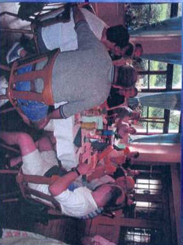
Abendessen Teilnehmer im Hotel Linde Freitagabend