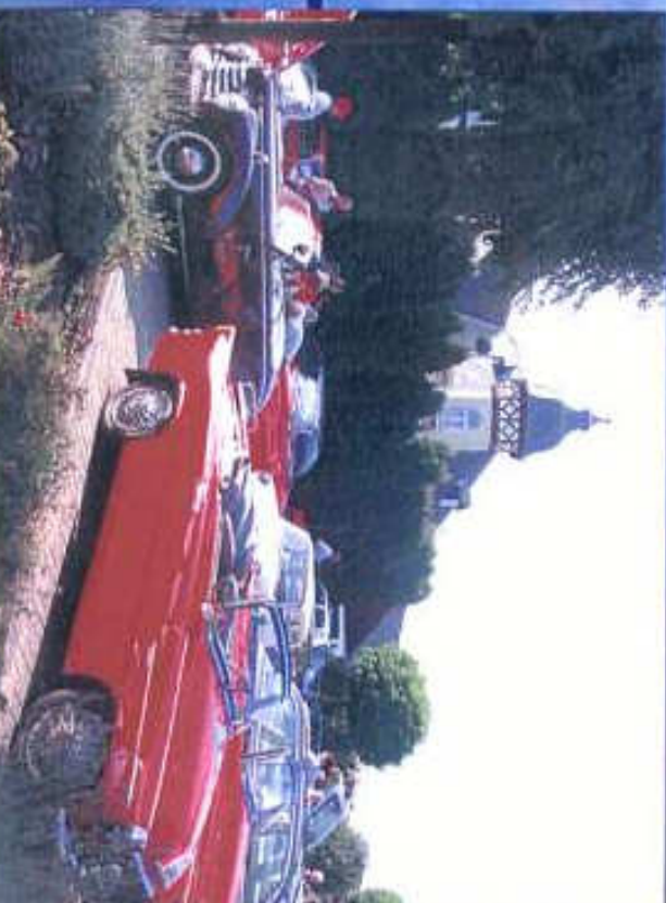
Inscere Fahrzeugen in Braunfels am Café Wödel