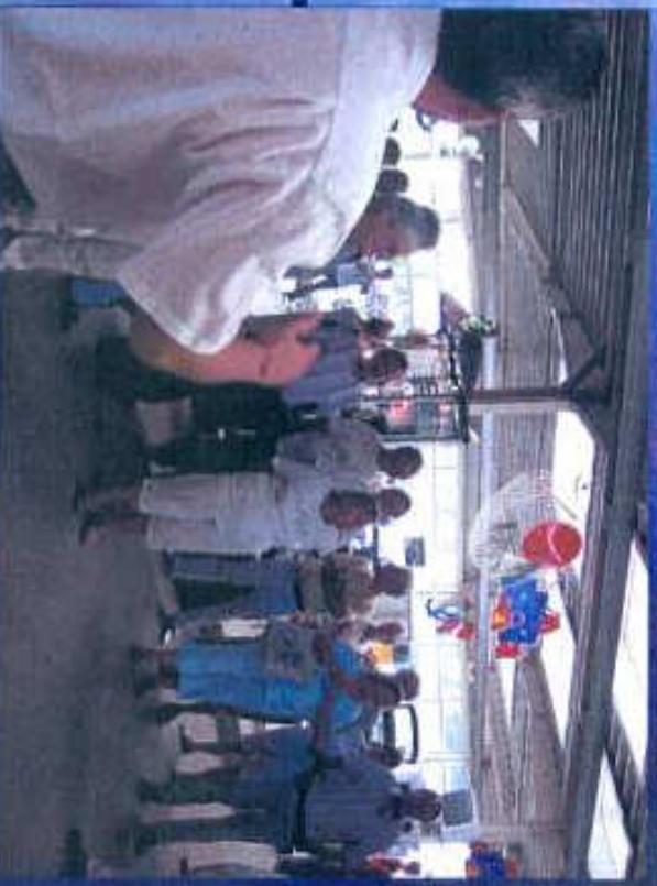
Buffet im Autohaus Pabst in Diez an der Lahn