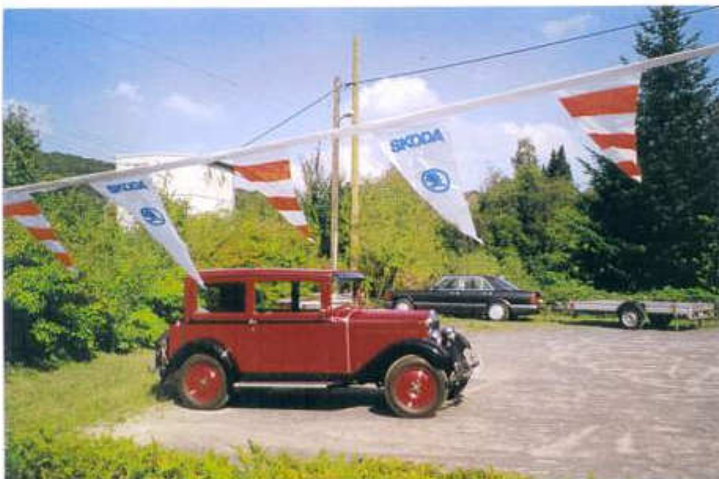
Der noch leere Parkplatz beim Hotel zur Linde