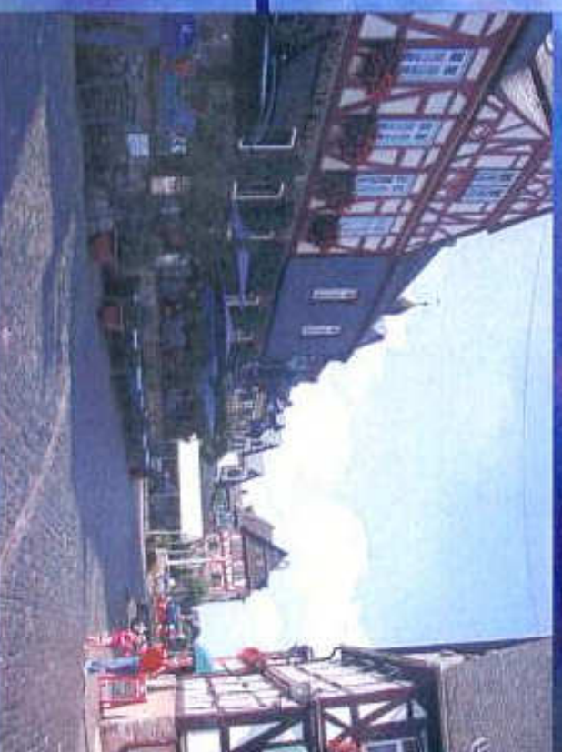
Stadtfrühburg in Braunfels-Salmrohr Hof