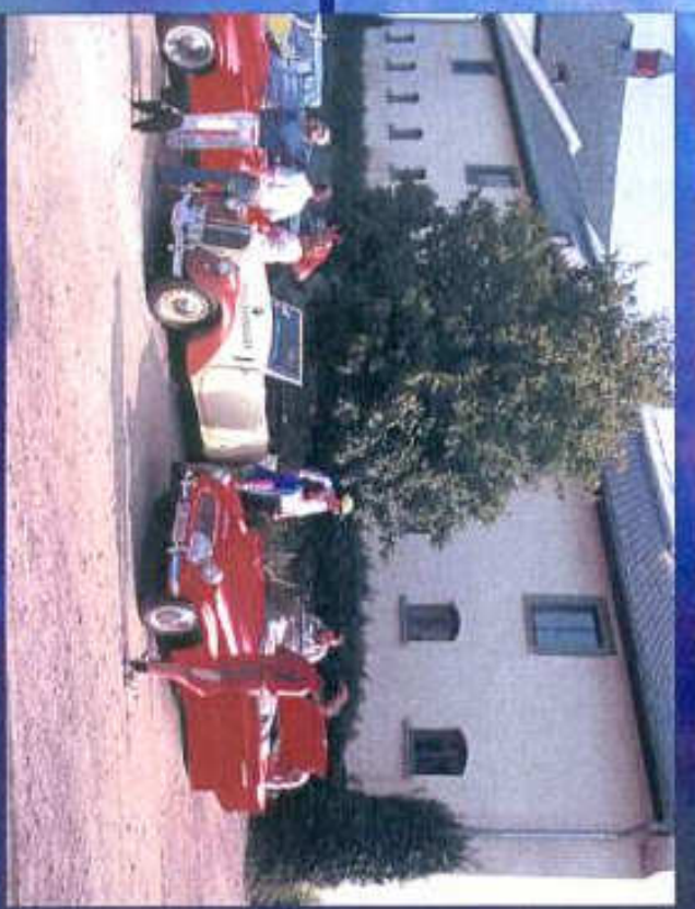
Rast in der Ökumenischen Kommunität Gnadenthal