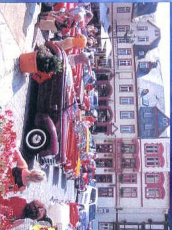
Fahrzeuge auf dem Marktplatz in Weilburg an der Lahn