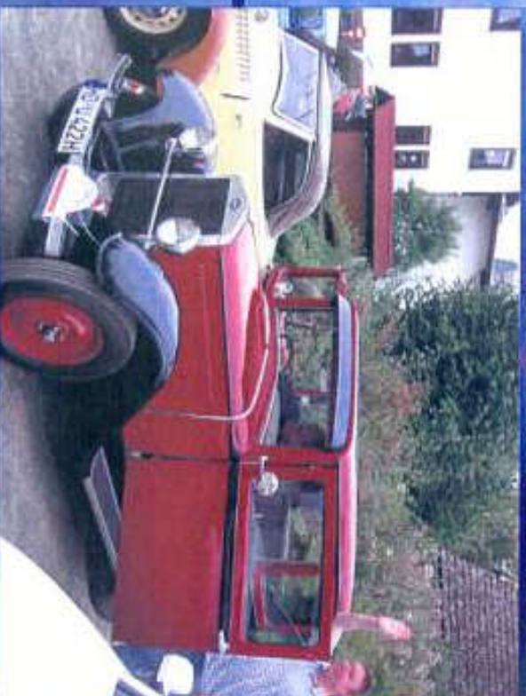
Verabschiedung von dem Team Ullrich auf dem Hotel- Parkplatz in Wehrhahn, Coesfeld