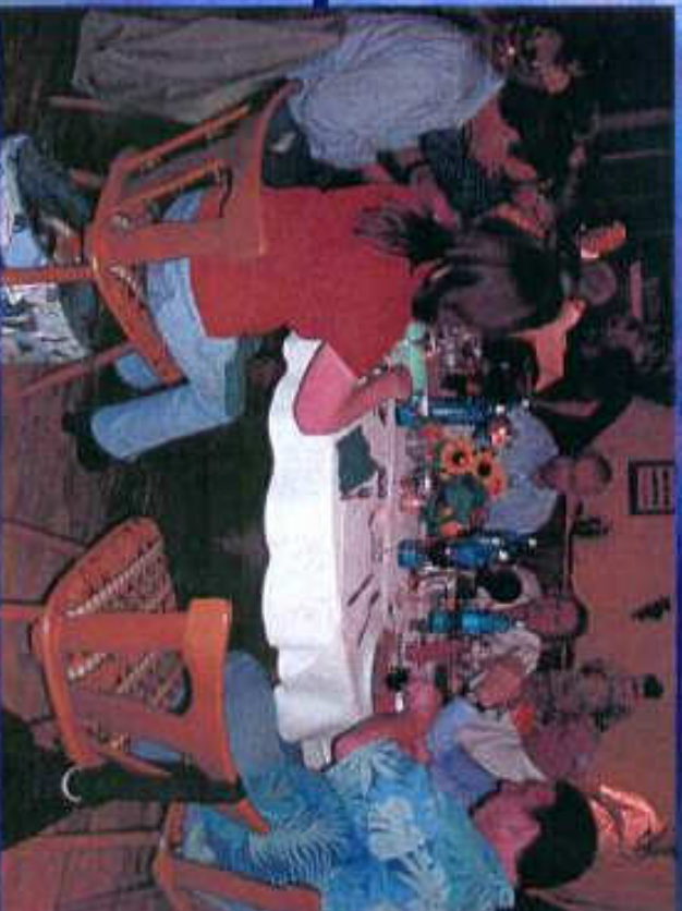
Tischgemeinschaft im Hotel zur Linde in Gemünden