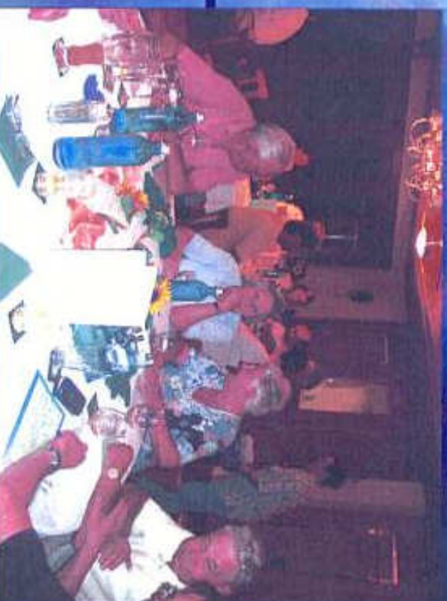
Abendessen Teilnehmer im Hotel Linde Freitagabend