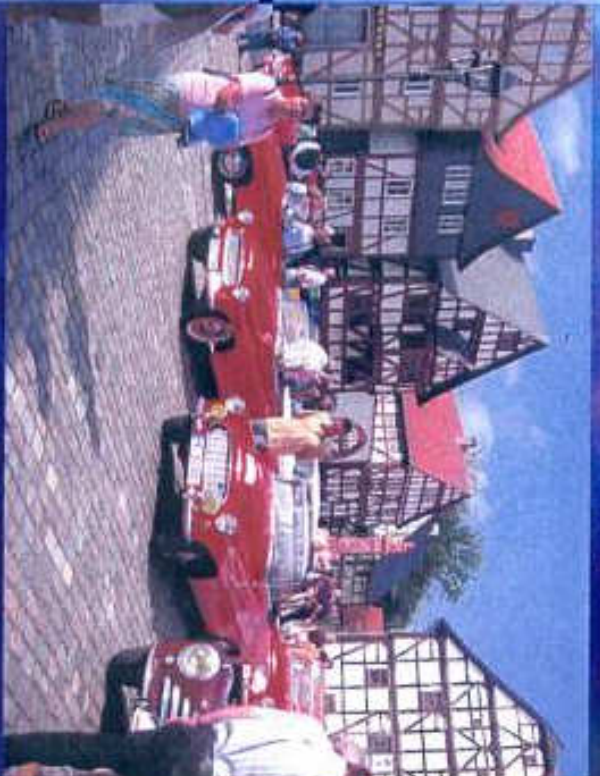
Präsentation auf dem Marktplatz im Hessenpark