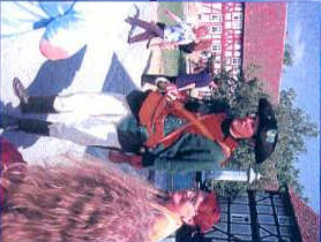
Förster in „Preußischer Uniform“ im Hessenpark