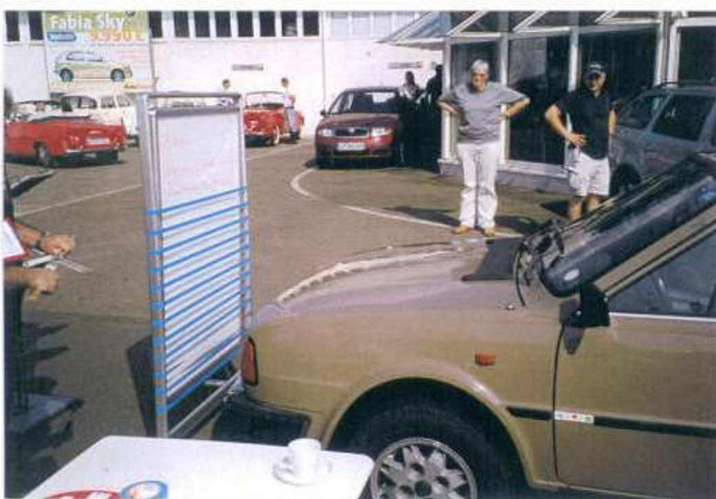
Messstand beim Zentimeterfahren