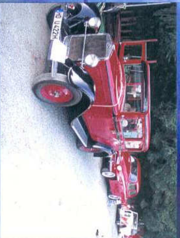
Aufstellung zur Ausfahrt nach Diez Weilburg Braunfels