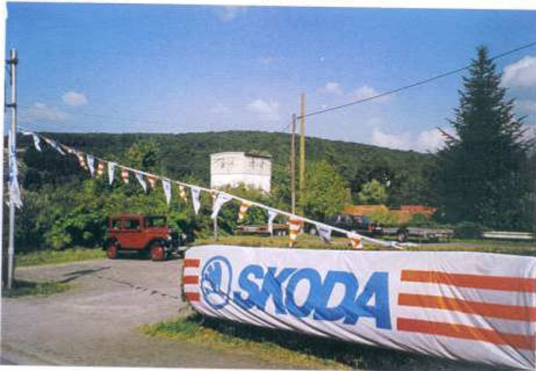
Seltene und alte Skodawerbefahne