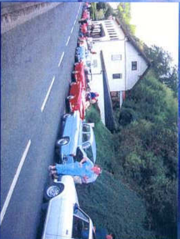
Nach dem Tanken auf dem Weg zum Hessenpark