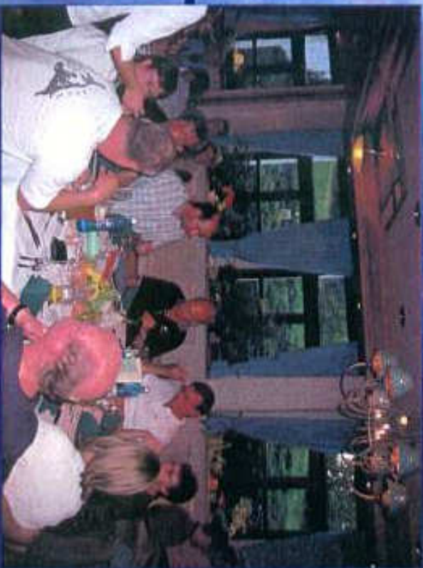
Tischgemeinschaft im Hotel zur Linde in Gemünden