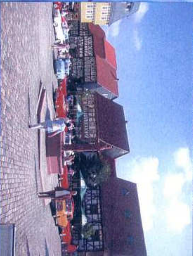
Präsentation auf dem Marktplatz im Hessenpark