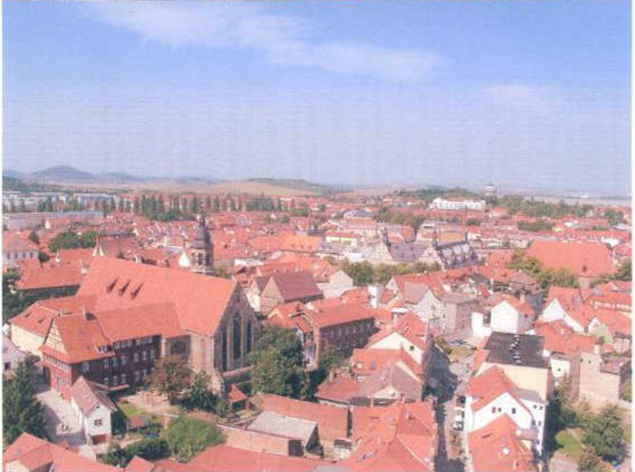
Abbildung 1 und 2 Luftaufnahme Arnstadt