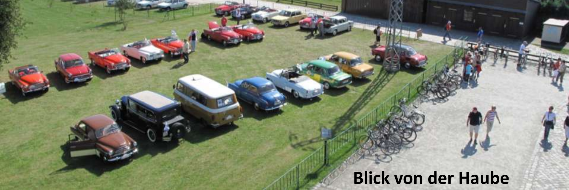
Blick von der Haube