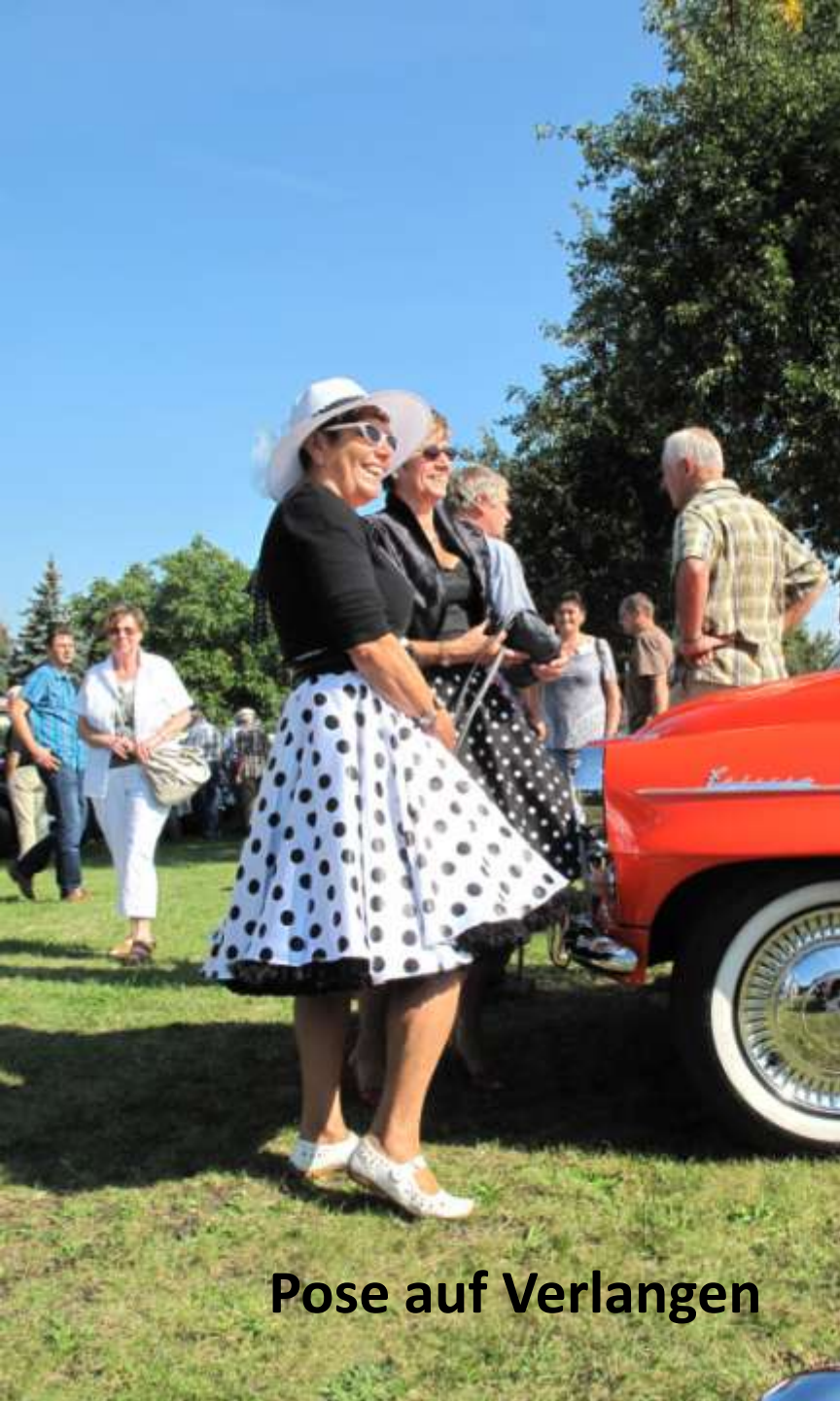
Pose auf Verlangen