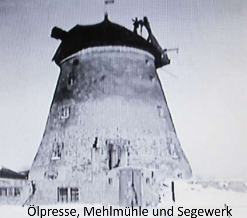
Ölpresse, Mehlmühle und Segewerk