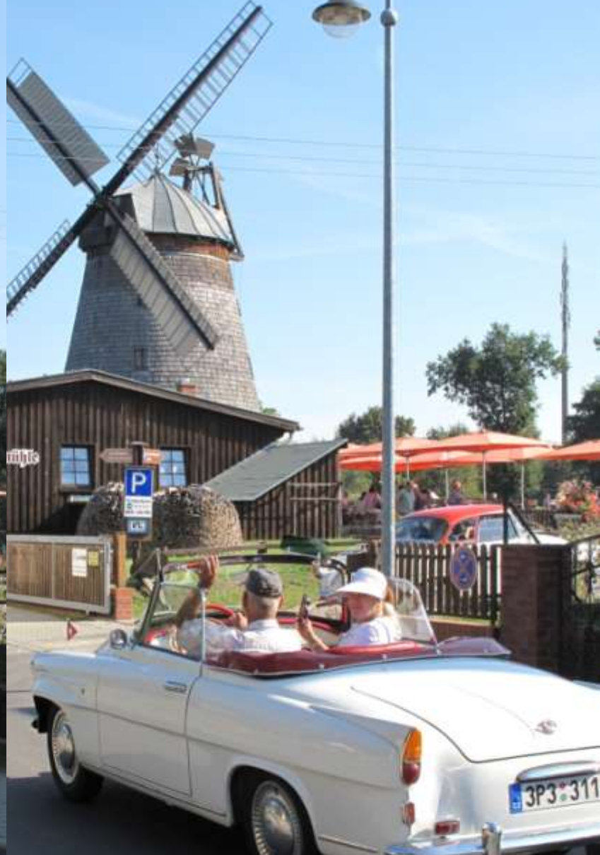
Bei der Dreifachmühle angekommen