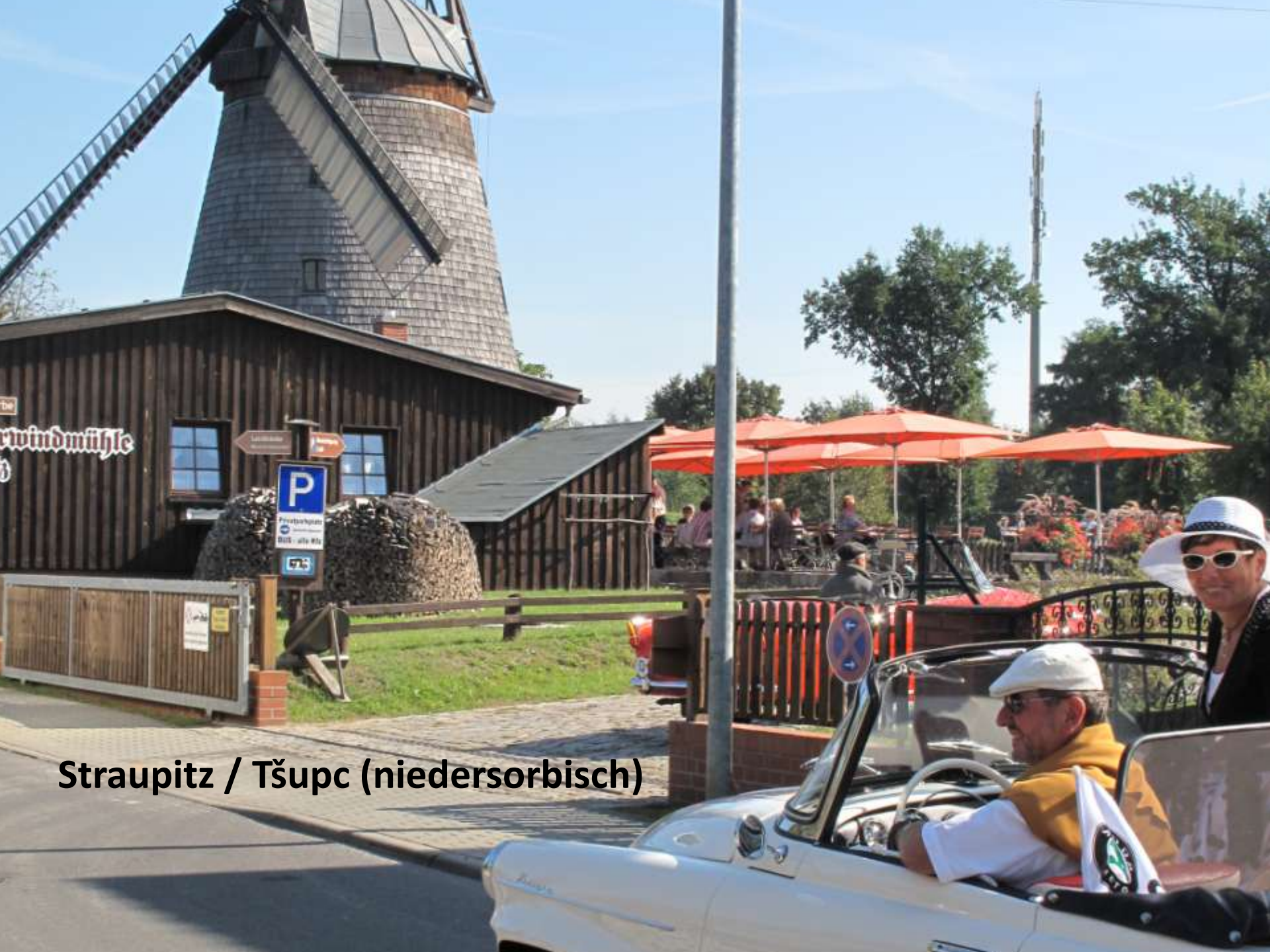
Straupitz / Tšupc (niedersorbisch)