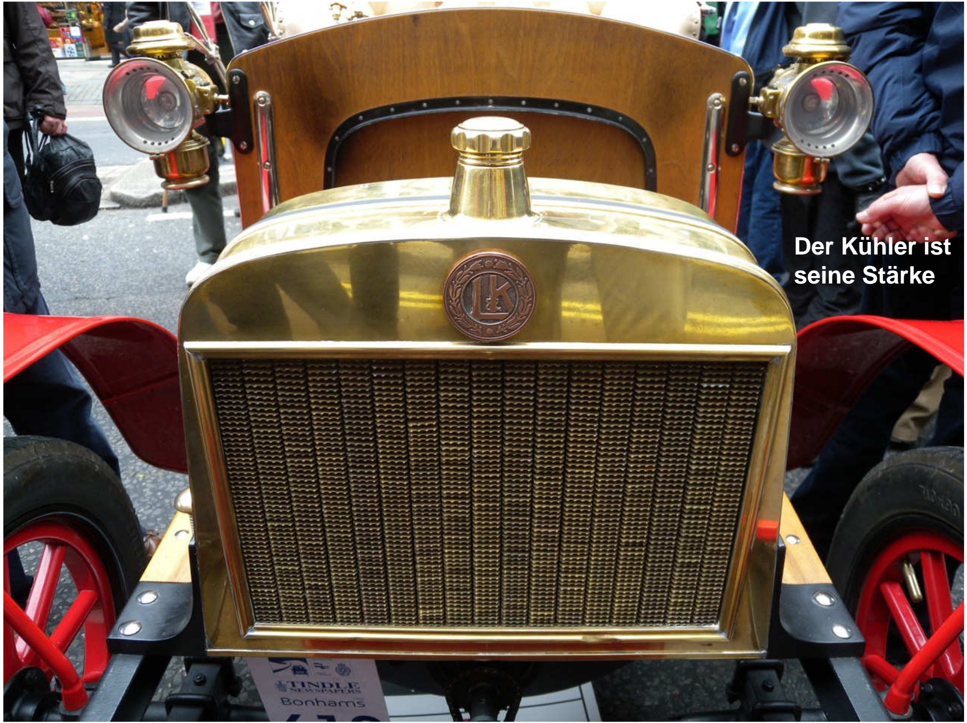
Der Kühler ist seine Stärke