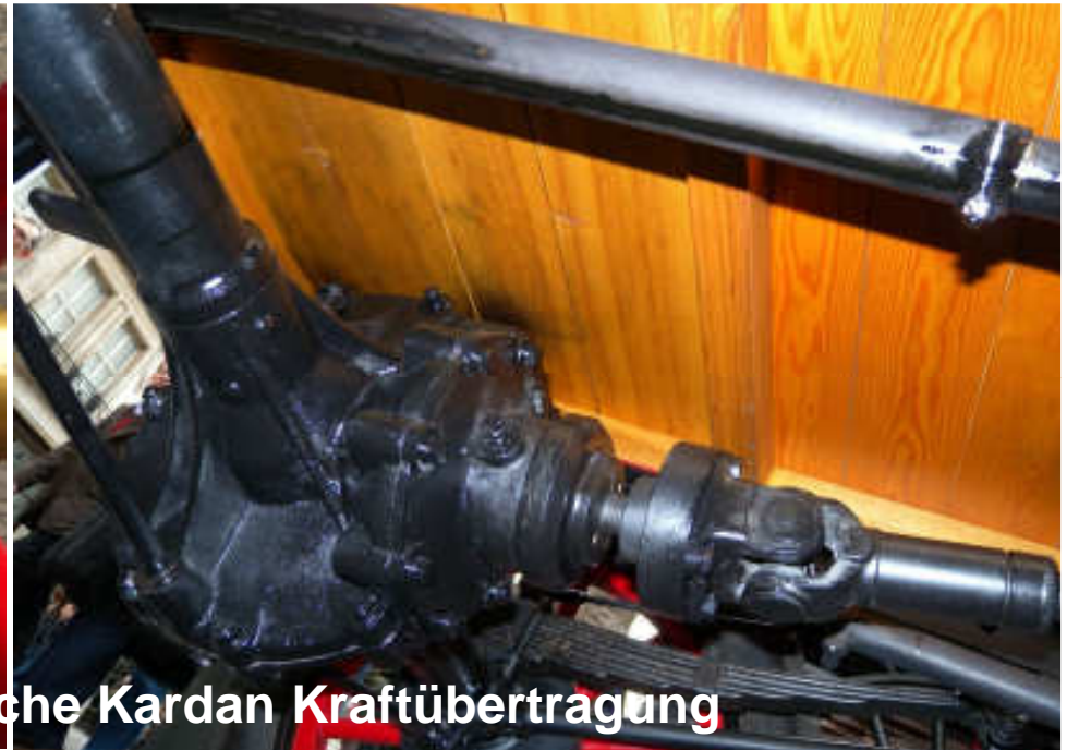
Bremse und die überzeitliche Kardan Kraftübertragung